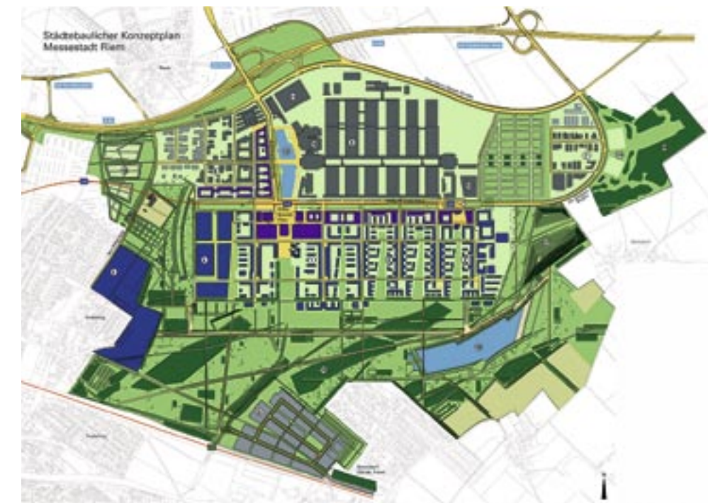
Städtebaulicher Konzeptplan Messestadt Riem